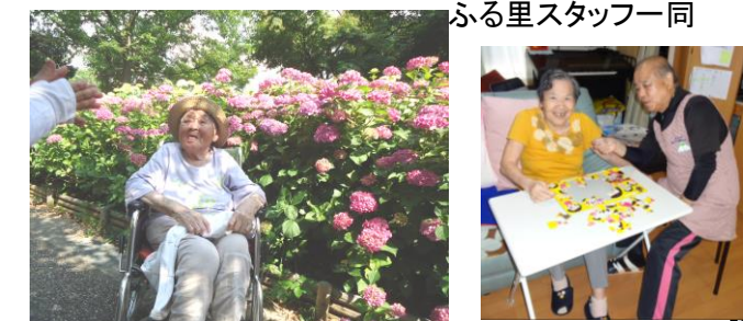
ふる里スタッフ一同